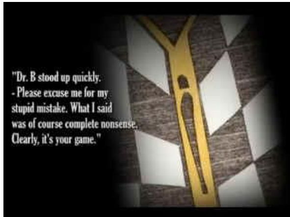
cortometraje brasileño con xilografías de la artista alemana Elke Rehder

¡Saludo a todos mis amigos! ¡Deseo que vean el aurora después de esta larga noche! Yo, más impaciente, me voy antes que ellos. Stefan Zweig Petrópolis 22, II 1942 »