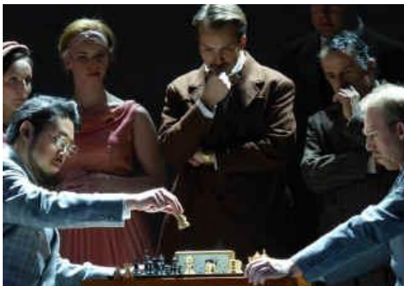
Opéra Le Joueur d'échecs avec Mirko Czentovic et le docteur B.