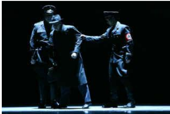
Stefan Zweig Le Joueur d'échecs Opéra deuxième scène.

Photos et renseignements sur la première mondiale de l'opéra Schachnovelle par le célèbre compositeur espagnol Cristobal Halffter à l'Opéra dans la ville allemande de Kiel