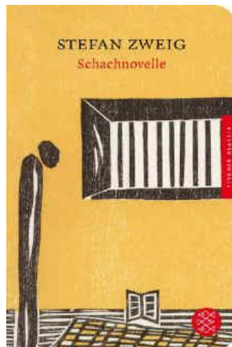
Stefan Zweig: Schachnovelle (Le Joueur d'échecs) - couvrir illustration par l'artiste Elke Rehder