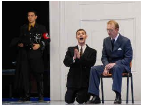
Stefan Zweig Le Joueur d'échecs Opéra deuxième scène.

Opéra deuxième scène: Dr. Leo Berger est arrêté à Vienne par la Gestapo sur la route. Les deux hommes de la Gestapo apporter Dr. B. à l'Hôtel Metropol, où il est déjà prévu par l'officier de la Gestapo.