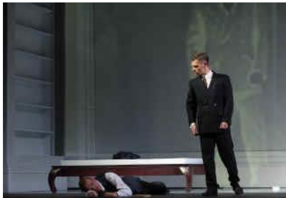
Opéra Schachnovelle - Le Joueur d'échecs - L'officier de la Gestapo et le docteur B.