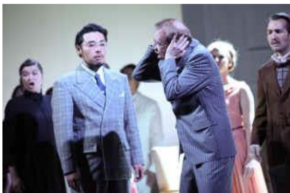
Opéra septième scène avec Mirko Czentovic et le docteur B.