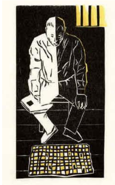
Schachnovelle 2013 gravure sur bois par l'artiste Elke Rehder à la mémoire de Stefan Zweig, contre l'isolement et l'isolement cellulaire et la torture.