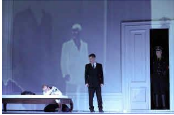
L'officier de la Gestapo et le docteur B. - Le Joueur d'échecs Opéra.