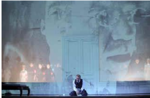
Stefan Zweig Le Joueur d'échecs Opéra quatrième scène.

basé sur Le Joueur d'échecs de Stefan Zweig. La performance est en allemand avec surtitres en allemands.