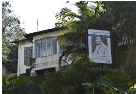
La photo montre la maison de Stefan Zweig et sa femme Lotte à Petrópolis avant la restauration et l'ouverture du nouveau musée.